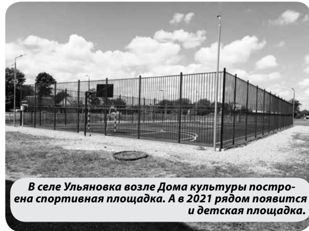
В селе Ульяновка возле Дома культуры построена спортивная площадка. А в 2021 рядом появится и детская площадка.

В 2020 году доля средств бюджета края составила