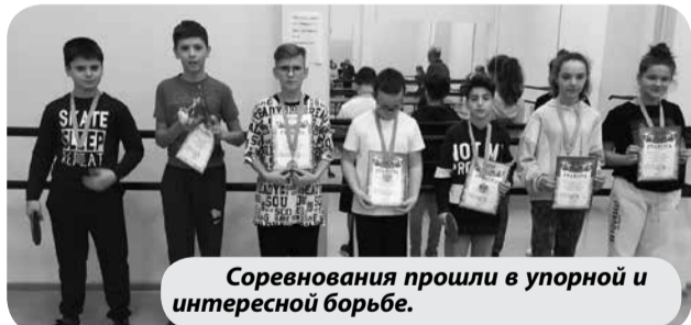
Соревнования прошли в упорной и интересной борьбе.

Новогодний турнир по настольному теннису среди детей прошел в минераловодском спортивном комплексе «Прометей».