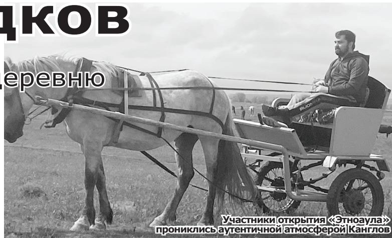
Участники открытия «Этноаула» прониклись аутентичной атмосферой Канглов