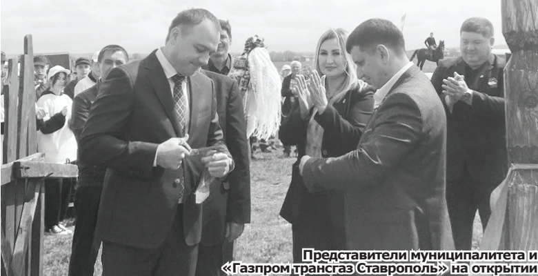
Представители муниципалитета и «Газпром трансгаз Ставрополь» на открытии

Этнографическая деревня создана в первую очередь для знакомства жителей и гостей КМВ с традициями и бытом ногайцев, издавна проживающих в здешних окрестностях. По замыслу организаторов, на территории площадью в 3,5 га будут проходить тематические мероприятия и сезонные фестивали.