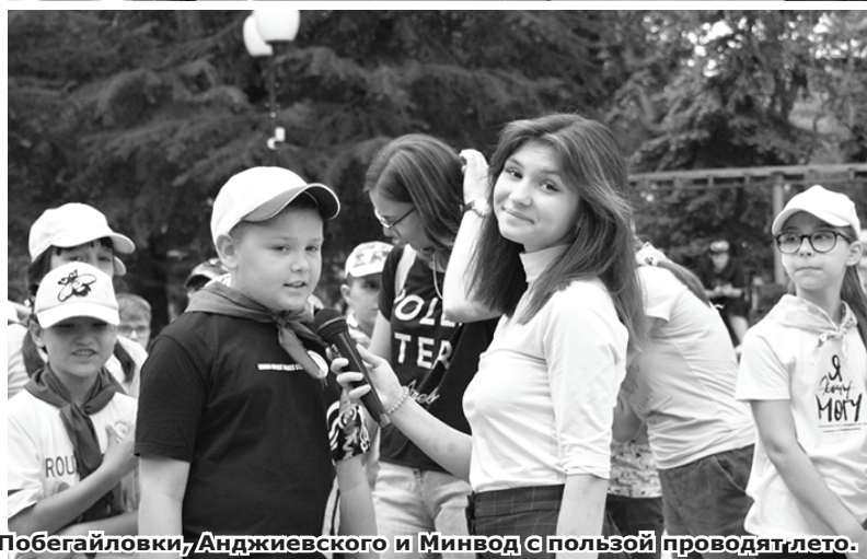
Школьники из Побегайловки, Анджиевского и Минвод с пользой проводят лето.

Спортивное, военно-патриотическое и туристическое направления в отраслевых лагерях, пришкольных лагеря и площадки, городские и сельские мероприятия, учебно-производственные бригады, Центры «Точка роста» – это далеко не полный перечень того, где может провести лето наше подрастающее поколение.