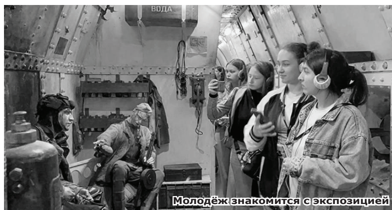
Молодёжь знакомится с экспозицией