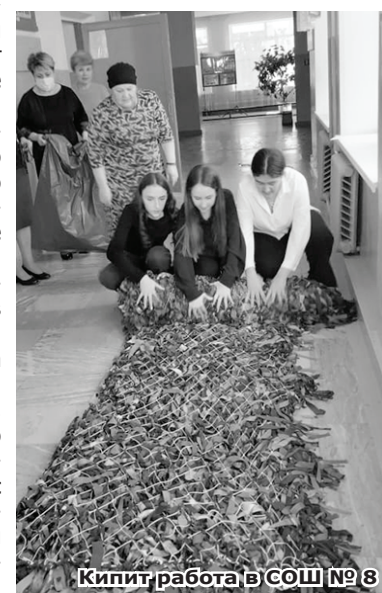
Кипит работа в СОШ № 8

Как считает губернатор, двери организаций, которые входят в инфраструктуру поддержки бизнеса в крае, для участников СВО всегда должны быть открыты.