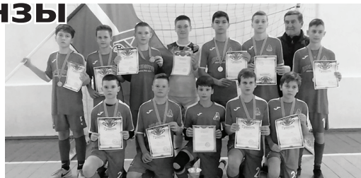
Суворовской и спортивной школы №1 «Эльбрус» из села Канглы.