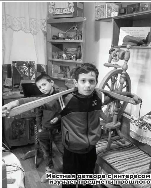
Местная детвора с интересом изучает предметы прошлого