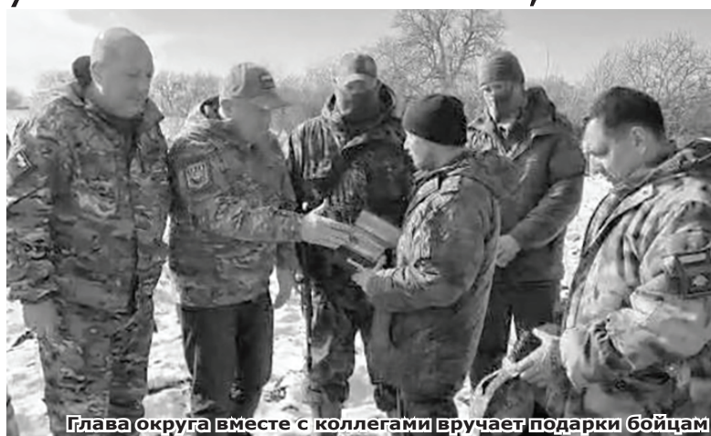
Глава округа вместе с коллегами вручает подарки бойцам