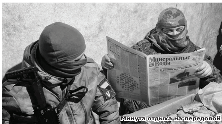
Минута отдыха на передовой